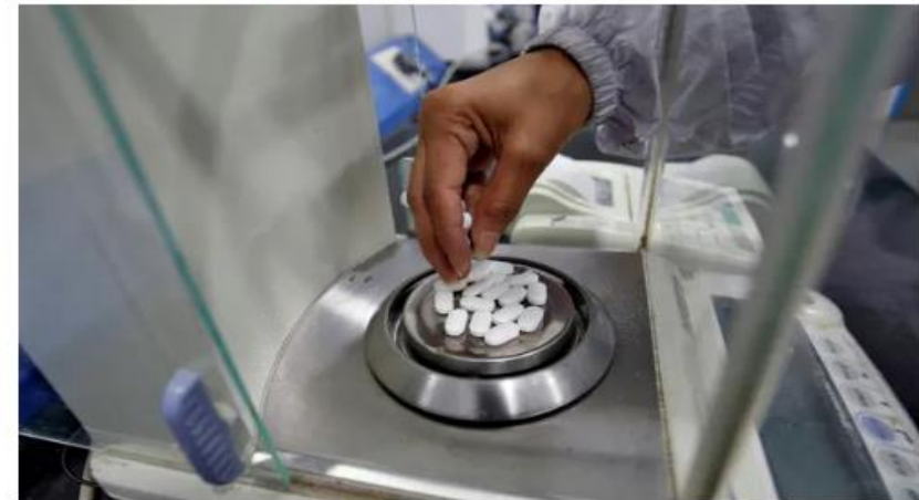
▲ A pharmacist checks paracetamol tablets at a lab on the outskirts of Ahmedabad, India.

The coronavirus outbreak has led India to restrict the export of dozens of drugs including paracetamol and various antibiotics, leading to fears of a global shortage of essential medicines.